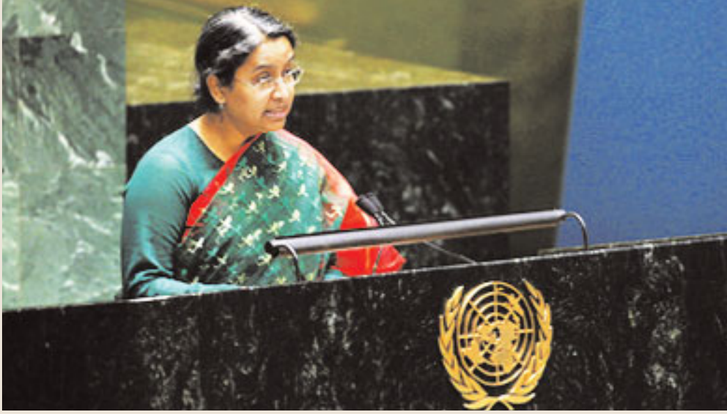
গণপ্রজাতন্ত্রী বাংলাদেশ সরকারের মাননীয় পরাম্ভমন্ত্রী ডা. দীপু মনি ভাষণ প্রদান করছেন

কাজ আরো দৃষ্টিগ্রাহ্য ও প্রাসঙ্গিক করার জন্য একটা নিরবচ্ছিন্ন প্রচেষ্টা চালানো হচ্ছে। ৫৮তম অধিবেশনের মতো এটা একটা অগ্রাধিকারে পরিণত হয়েছে এবং প্রধান কমিটিগুলোর এজেন্ডা প্রণালিবদ্ধ করা, চর্চা ও কার্যপদ্ধতি উন্নত করা, সাধারণ পরিষদের ভূমিকা বিস্তৃত করা, সভাপতির ভূমিকা ও কর্তৃত্ব বৃদ্ধি করা এবং মহাসচিব মনোনয়ন প্রক্রিয়ায় পরিষদের ভূমিকা পরীক্ষা করার জন্য সাধারণ পরিষদের পরবর্তী অধিবেশনগুলোতে প্রচেষ্টা অব্যাহত রয়েছে।