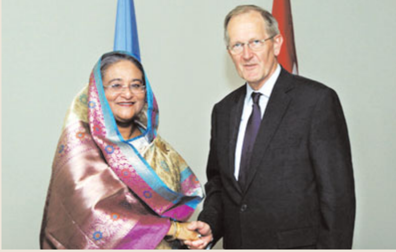
জাতিসংঘ সাধারণ পরিষদের জোসেফ ডেইস গনপ্রজাতন্ত্রী বাংলাদেশ সরকারের মাননীয় প্রধানমন্ত্রী শেখ হাসিনার সঙ্গে সাক্ষাৎ করেন

রিপোর্ট প্রদান করেন, যে চর্চা ৫২তম অধিবেশনে শুরু হয়েছিল।