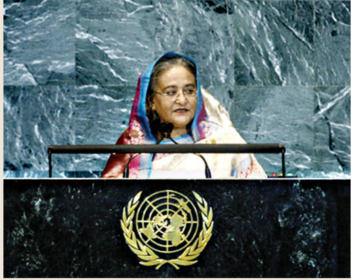
গণপ্রজাতন্ত্রী বাংলাদেশ সরকারের মাননীয় প্রধানমন্ত্রী শেখ হাসিনা জাতিসংঘ সাধারণ পরিষদের ৬৫তম অধিবেশনে ভাষণ দিচ্ছেন

জাতিসংঘ সাধারণ পরিষদের ৬৫তম অধিবেশন ১৪ সেপ্টেম্বর নিউইয়র্কে জাতিসংঘ সদর দপ্তরে শুরু হয়েছে। উদ্বোধনী সপ্তাহের পর রাষ্ট্র ও সরকারপ্রধানগণ মিলেনিয়াম উন্নয়ন লক্ষ্যগুলোর (এমডিজি শীর্ষ সম্মেলন) ওপর ২০ থেকে ২২ সেপ্টেম্বর তিনদিনব্যাপী এক উচ্চ পর্যায়ে পূর্ণাঙ্গ অধিবেশনে মিলিত হন।