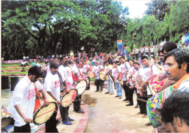
ঢোল বাজিয়ে দারিদ্র্যের বিরুদ্ধে সংহতি প্রকাশ করা হচ্ছে