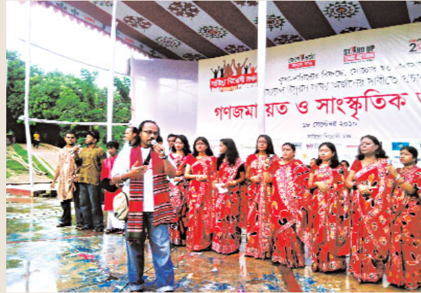
শিল্পীরা দারিদ্র্যবিরোধী সঙ্গীত পরিবেশন করছেন